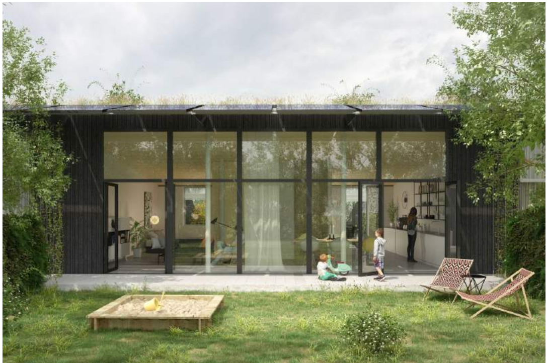
Afbeelding 6: impressie van de glasgevel van de Eemgoed M woning