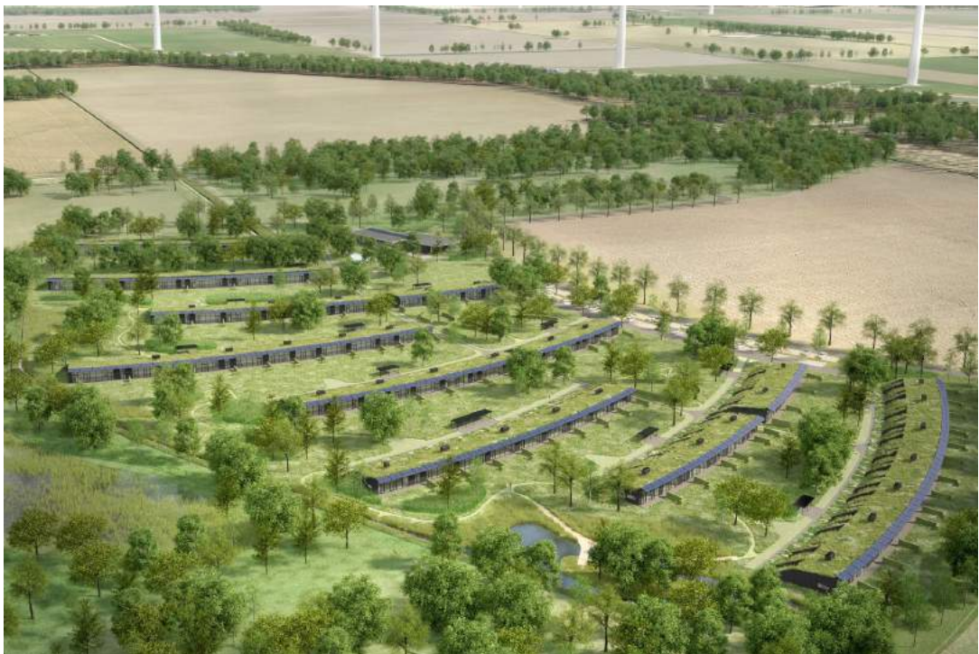
Afbeelding 1: vogelvlucht impressie van 't Eemgoed, 82 woningen, 10 landschapskamers op 7 hectare en een gemeenschapshuis voor privé, werk en landgoedleven

Deze drie woningen zijn onlangs vrijgekomen, alle overige woningen zijn reeds verkocht.