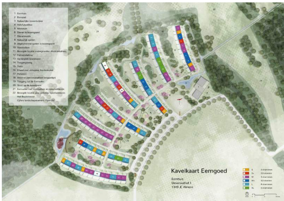
Afbeelding 3: Eemgoed kavelkaart - de drie witte kavels zijn te koop | kavelkaart

De woningen zullen naar verwachting in het 4 e kwartaal 2021 worden opgeleverd.