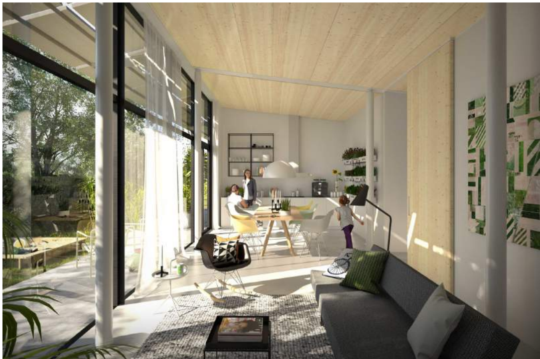
Afbeelding 4: interieur impressie van de Eemgoed M woning

Méer informatie op de projectwebsite www.eemgoed.nl