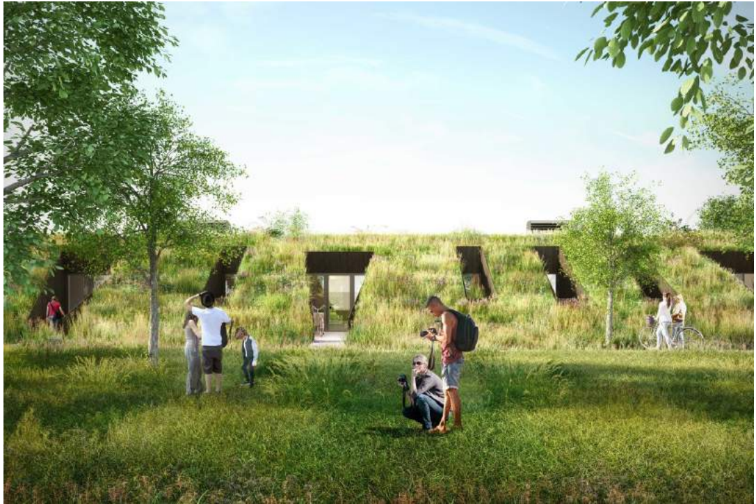
Afbeelding 5: impressie van de entree van de woningen in een longhouse